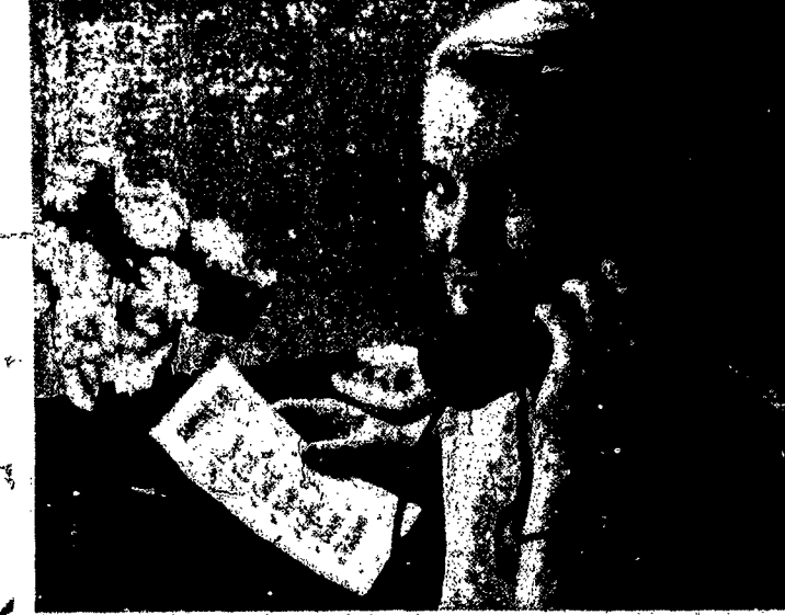
355,000 PHONES ADDED IN 1951 make the telephone more valuable than ever. In New York communities, users can now reach twice as many phones without toll charge as ten years ago. One reason why the telephone is one of today's biggest bargains.