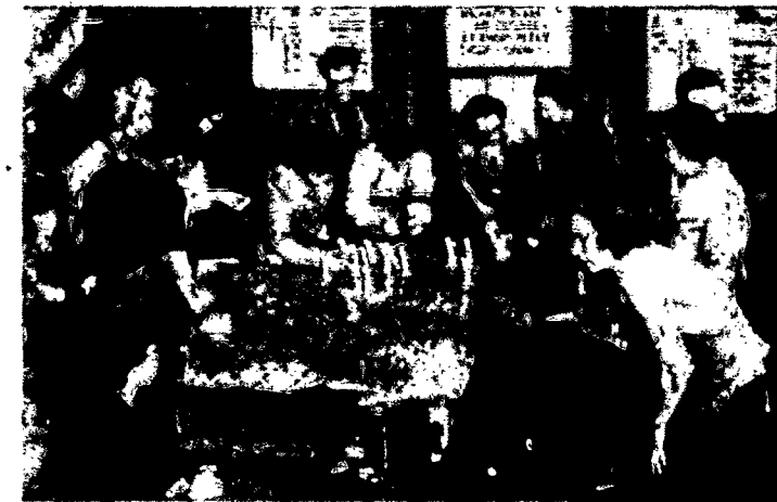
FIRST CALL GIVEN DEFENSE NEEDS. Telephones play a major role in tracing the route of airplanes at the White Plains Filter Center, one of many Civil Defense projects completed in 1951. The Telephone Company's own defense program includes expanding facilities for routing telephone traffic around disaster points, provision for stand-by power, and for mobile radio and portable telephone units.