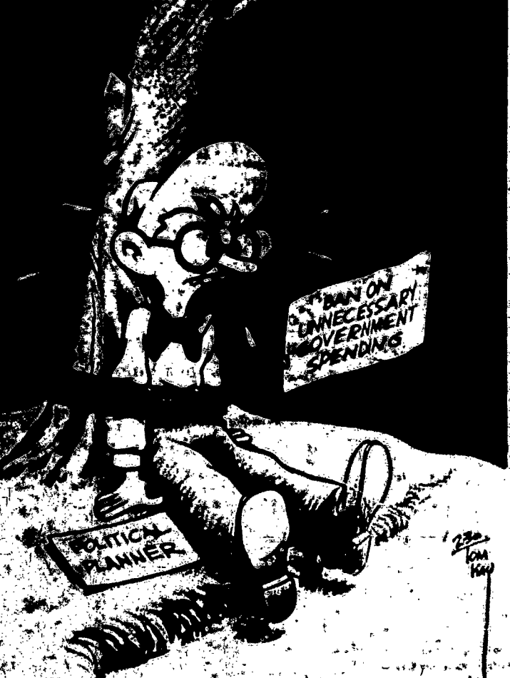
The One And Only Needed Control