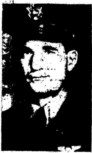
MAJ. WILLIAM V. HOLOHAN

Fra l'altro la petizione dice: "L'unica e giusta soluzione delle paghe, è di fare una sistematica analisi del lavoro di ogni singolo impiegato, il numero delle ore ed i pericoli ai quali è esposto e stabilire una paga decente, in relazione all'abilità ed all'addebiamento, in base ai meriti, ed ai pericoli ai quali è continuamente esposto".