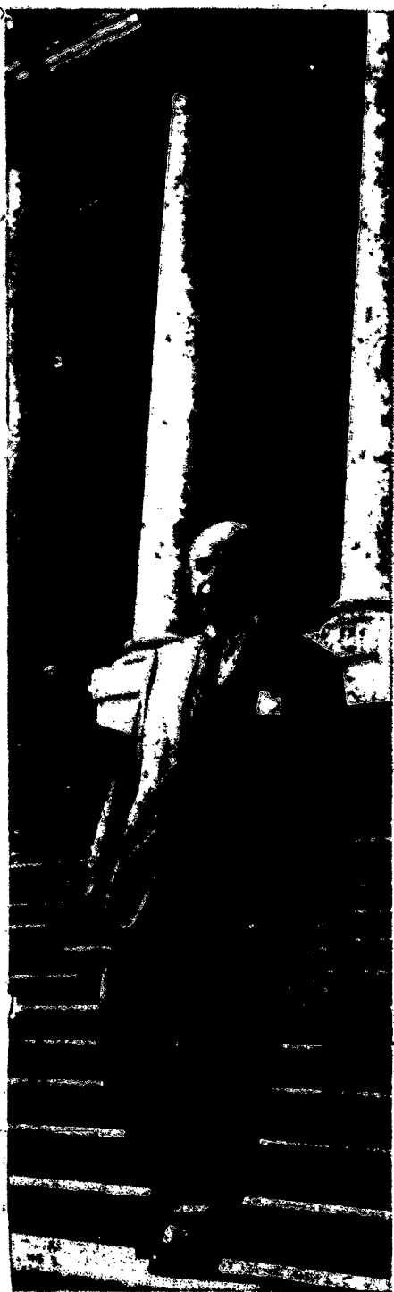
Herbert H. Lehman

è il campione del popolo, il difensore dei suoi diritti. E' un uomo che ha portato al Senato la sua saggezza e la sua grande esperienza di cittadino, di governatore, di senatore e di giurista. Votate il 7 Novembre per la rielezione a Senatore di HERBERT H. LEHMAN .